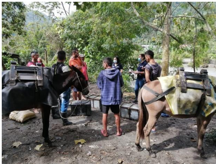
Mineros de subsistencia del corregimiento de Coello Cocora del municipio de Ibagué (11/05/2022)

La dirección de recursos naturales concertó este espacio con los mineros de subsistencia para continuar con el apoyo los avances en los procesos de formalización.