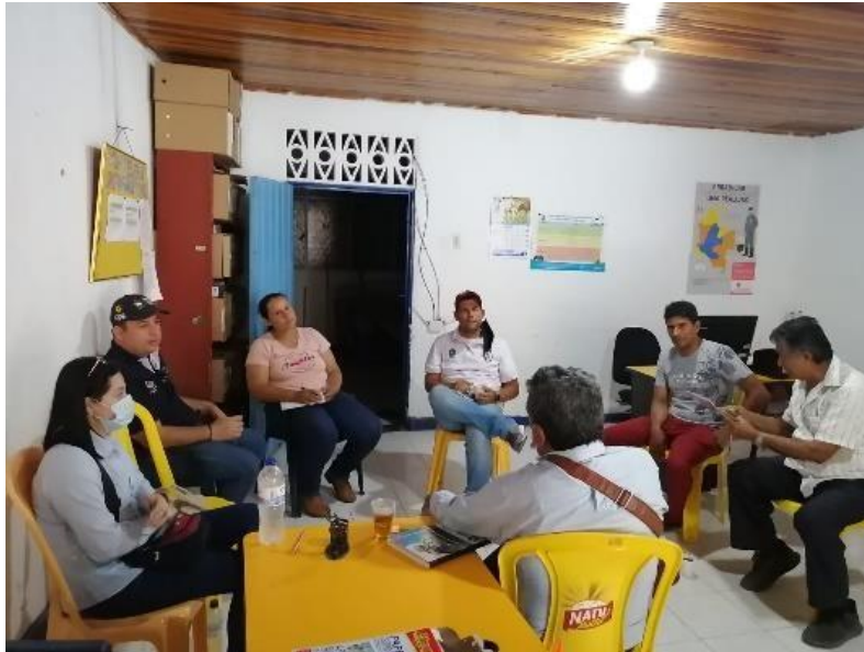
Mesa de trabajo con mineros de subsistencia y representantes de administración municipal del Valle de San Juan. (25/05/2022)

Actividad económica: EXTRACCIÓN ARTESANAL DE METALES PRECIOSOS