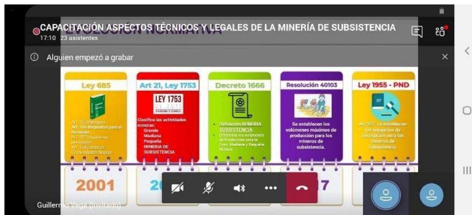
Mesa de trabajo con los mineros de subsistencia y en compañía de funcionarios de la UMATA de Cajamarca y el equipo de trabajo de la DRNNR. (28/06/2022)

El 28 de junio de 2022, se realizó la Mesa de trabajo con cuatro (4) de los mineros de subsistencia del municipio y en compañía de funcionarios de la UMATA de Cajamarca en representación del Sr. alcalde Municipal, equipo de la SDE y funcionarios de la ANM. Este encuentro se realizó de manera virtual toda vez que no fue aprobada la comisión de traslado de los funcionarios de la ANM.